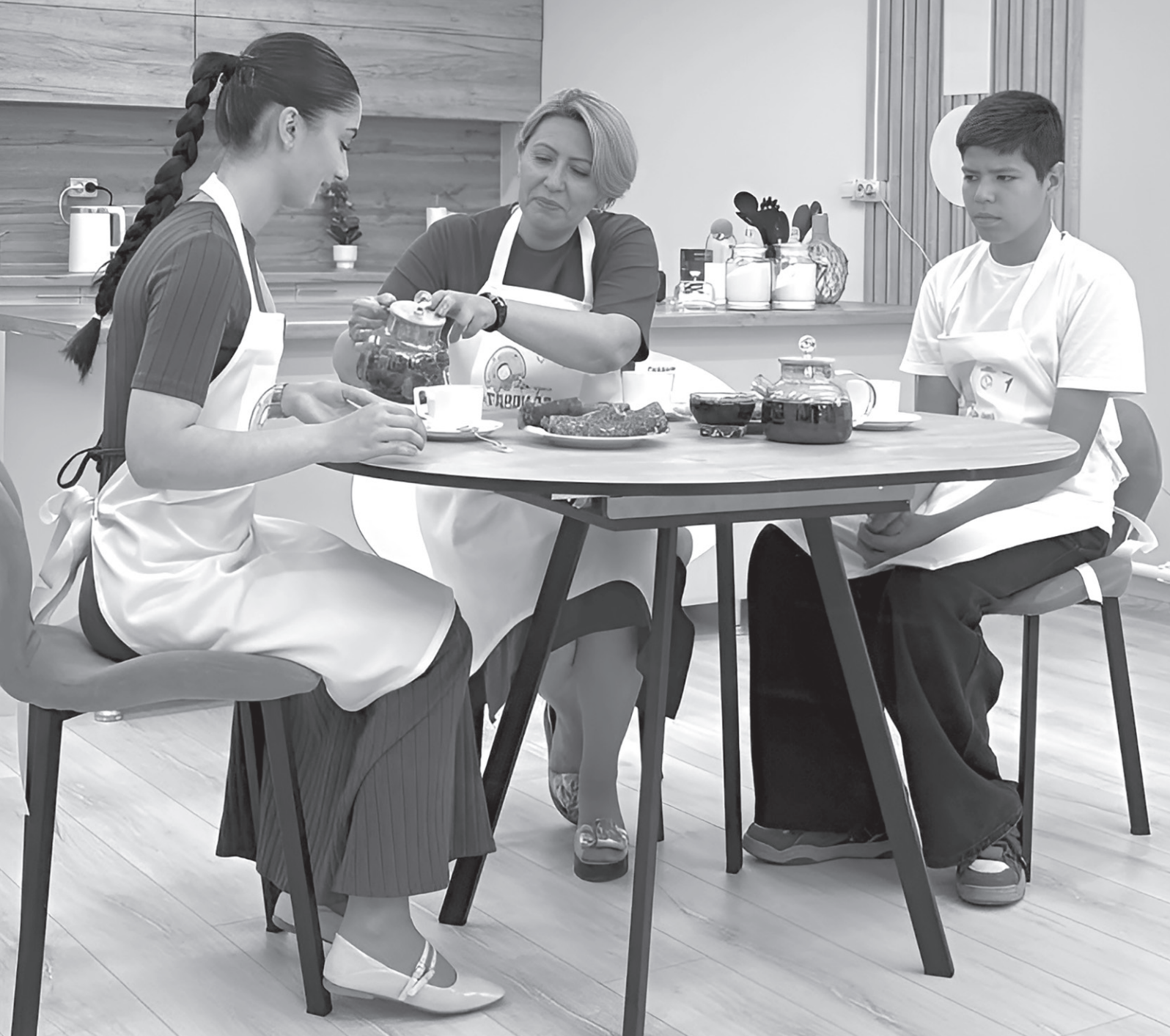
В молодежном центре в рамках проекта «Новые перспективы» действует арт-кухня «Таврида»

Ракурс В Карачаево-Черкесии последовательно формируется современная инфраструктура для молодёжи — не только в столице республики, но и в сельских территориях. Ярким подтверждением этого курса стал молодёжный центр в посёлке Кавказском. Сегодня этот центр — полноценная точка притяжения, где молодёжь учится, отдыхает,