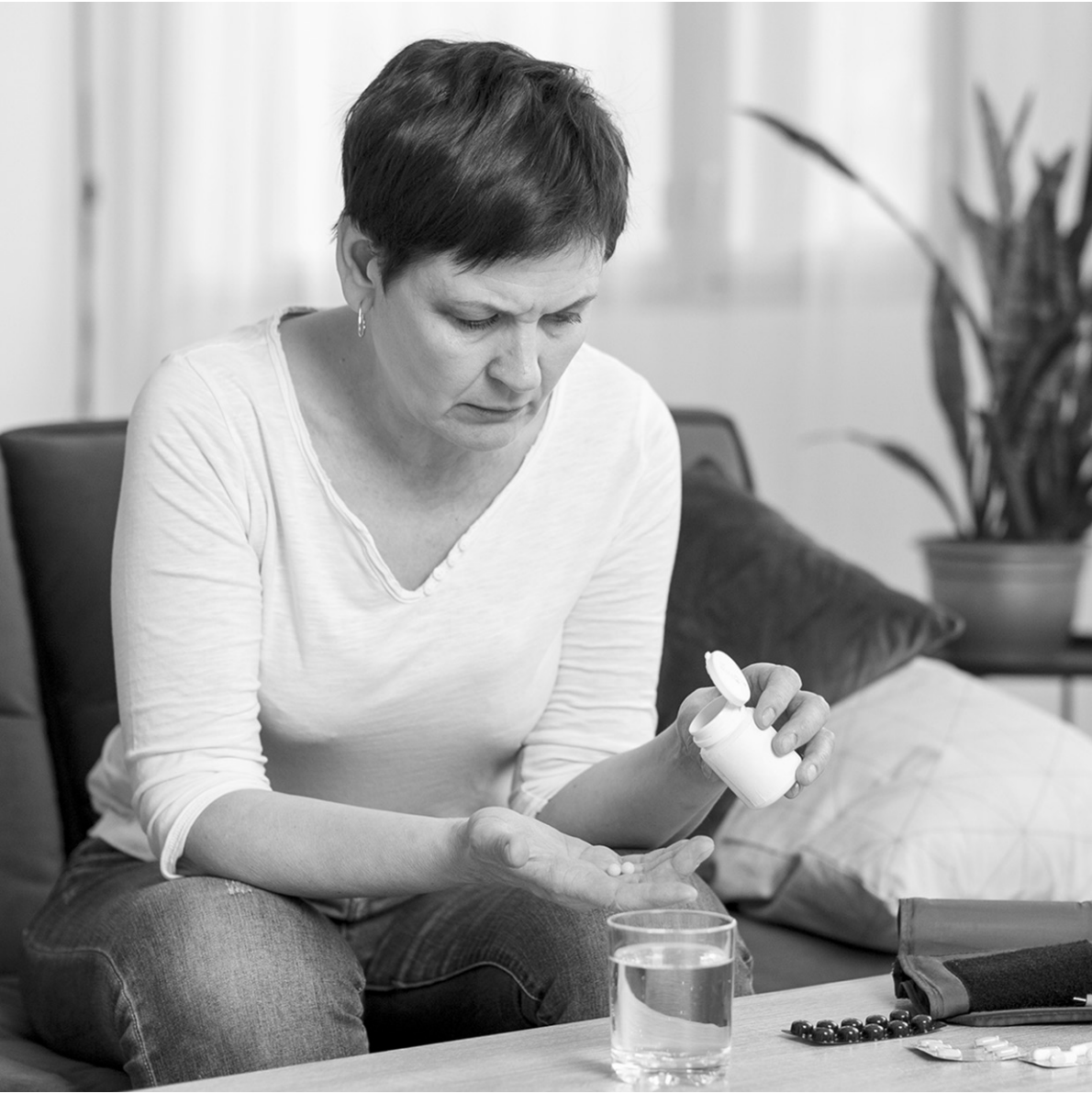
Перед приемом лекарства обязательно ознакомьтесь с инструкцией

Алкоголь усиливает побочные эффекты антидепрессантов на центральную нервную систему, вызывая сонливость и головокружение, а также снижая эффективность этих препаратов. Несовместимы с алкоголем и Z-препараты от бессонницы. Передозировка